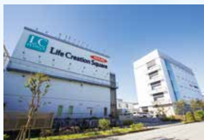
Life Creation Square

2019年にISO9001（2015年版）品質管理マネジメントシステムを改めて再取得しました。お客様に喜ばれる企業であり続けるという品質方針を掲げ、効率的で効果的なサービスを提案・提供してまいります。