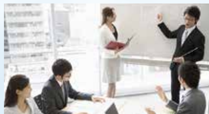
コンサルティング

FSSC22000、ISO22000、SQF など規格認証の取得支援をはじめ、HACCP義務化に伴う衛生管理業務の構築サポートや、工場衛生監査を代行します。