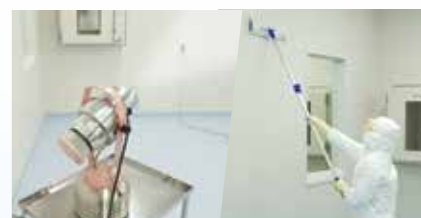
サニテーション・デコンタミネーション

清掃しにくい製造ラインや配管内の洗浄、空調内や、貯水槽の清掃を代行。また効率的な洗浄方法や清掃道具もご提案します。