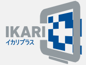
イカリプラス 【衛生管理のデジタルソリューション】