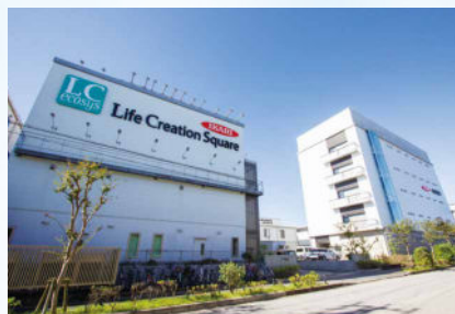
Life Creation Square

2019年にISO9001（2015年版）品質管理マネジメントシステムを改めて再取得しました。「品質のイカリ」の精神にのっとり、お客様に喜ばれる企業であり続けるという品質方針を掲げ、お客様の要望・期待に応えるため関係者のみなさまと共に安定したプロセス管理により、効率的で効果的なサービスを提案・提供してまいります。