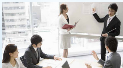
コンサルティング

基礎から専門知識まで、最新の技術と情報を反映したワークショップや模擬監査、実物観察などを通じ、実践的なスキルが身につく従業員教育を提供します。