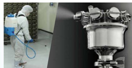
サニテーション・デコンタミネーション