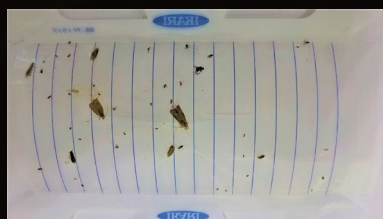
1日目(47匹、優占種:ユスリカ)