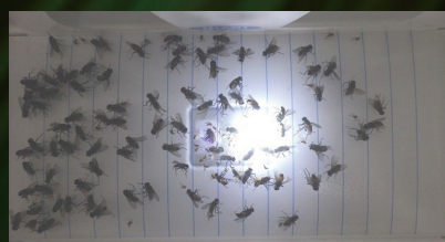
条件:個室でイエバエ100個体、 ノミバエ100個体ずつ放虫 (24時間後:イエバエ92個体、ノミバエ77個体)