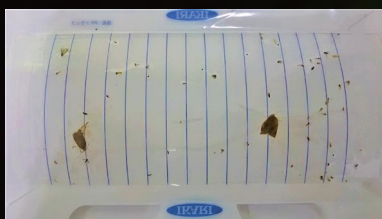
2日目(61匹、優占種:ユスリカ)